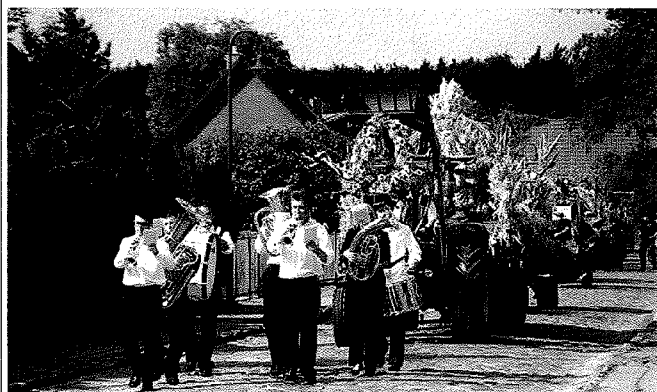
Mit Blasmusik wurde der Festumzug angeführt.