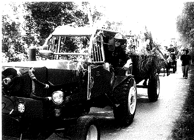
Auch Oldtimer nahmen am Umzug teil.