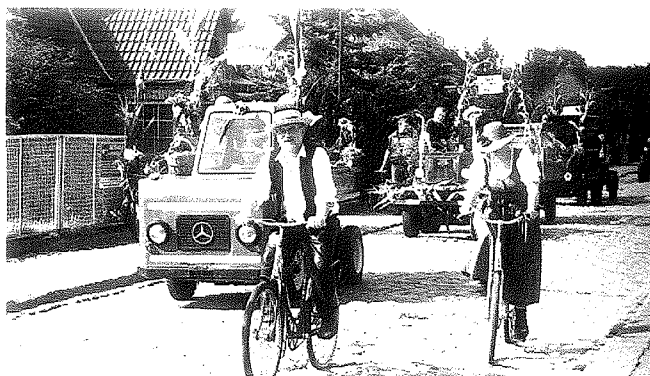
Radfahrer mit originellen Trachten komplettierten den Festumzug.